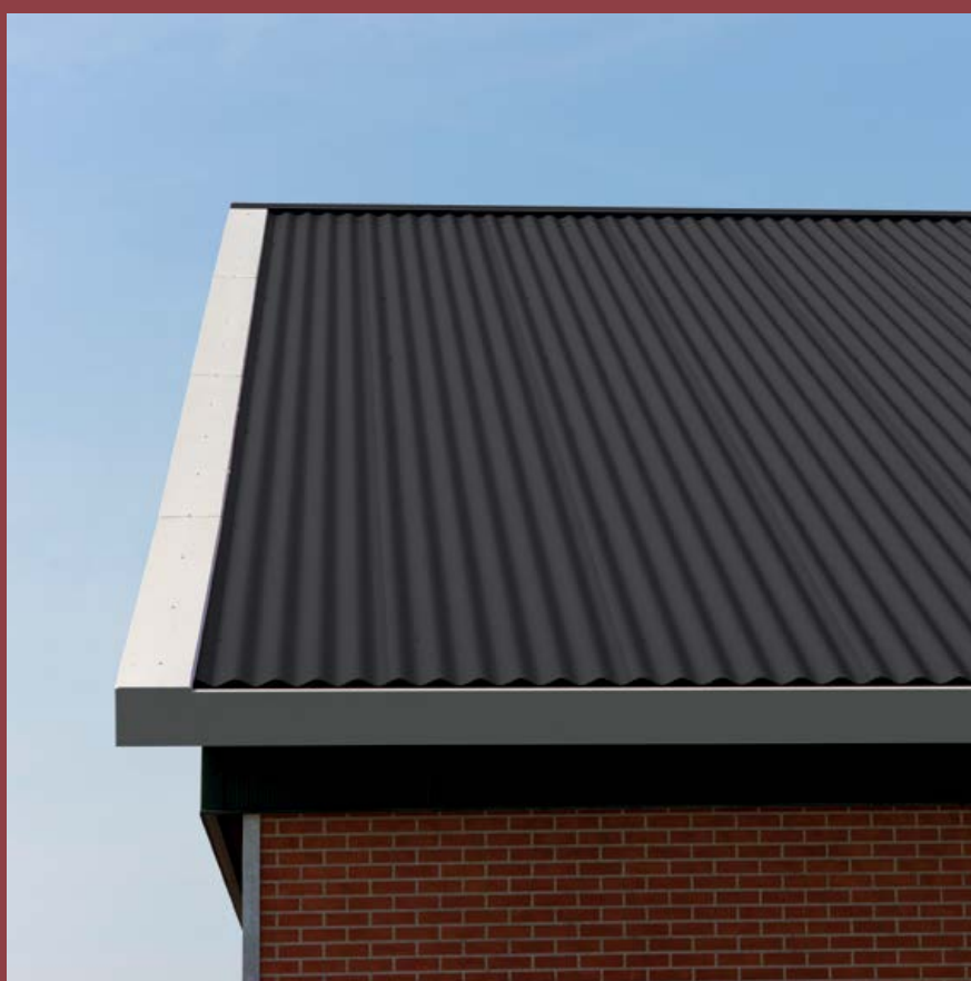
Sinusoidal Geïsoleerd Dakpaneel KS1000 SRW